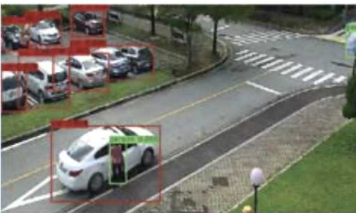
<지능형 영상 분석 기술>