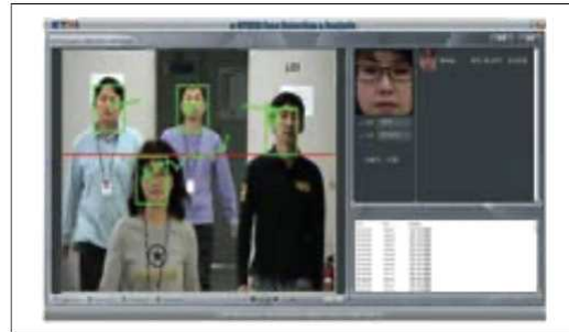
<CCTV 분석 기술>