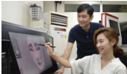
<실감 콘텐츠 기술>