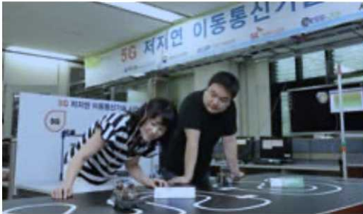
<5G 저지연 이동통신 기술>

- 주요 연구 성과: TDX, CDMA, WiBro, 지상파 DMB, 4세대 이동통신 LTE-A, 휴대형 한/영 자동통역, 클라우드 컴퓨팅, 실감미디어, 유헤스케어, 투명촉각센서, 사물인터넷, 엑소브레인